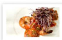
Crevettes poêlées et salsa de poivrons rôtis